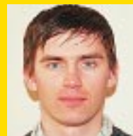
Подготовил юристконсульт ССПЛ Каспар Раченайс

■ Помните, что о подобных случаях члены профсоюза имеют право сообщать в Государственную инспекцию по труду!