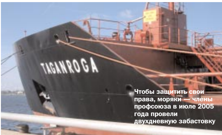
Чтобы защитить свои права, моряки — члены профсоюза в июле 2005 года провели двухдневную забастовку