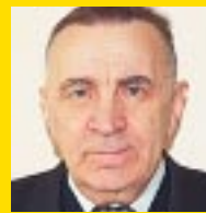
Подготовил юристконсульт ССПЛ Алфред Катлапс