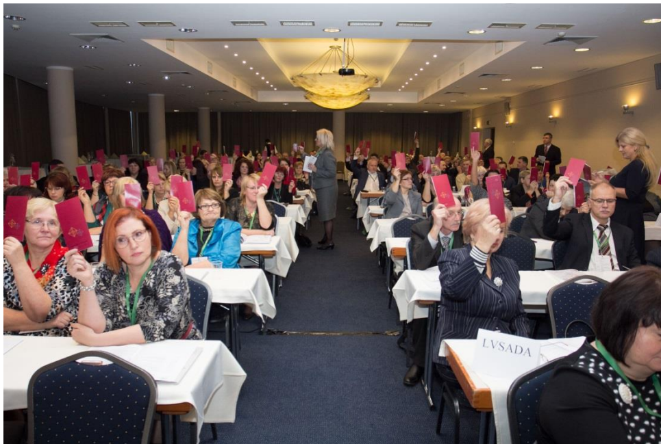
LBAS 6th Congress 2 December 2016