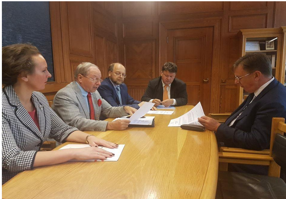
Social partners meet with the Prime Minister on 11 July 2017