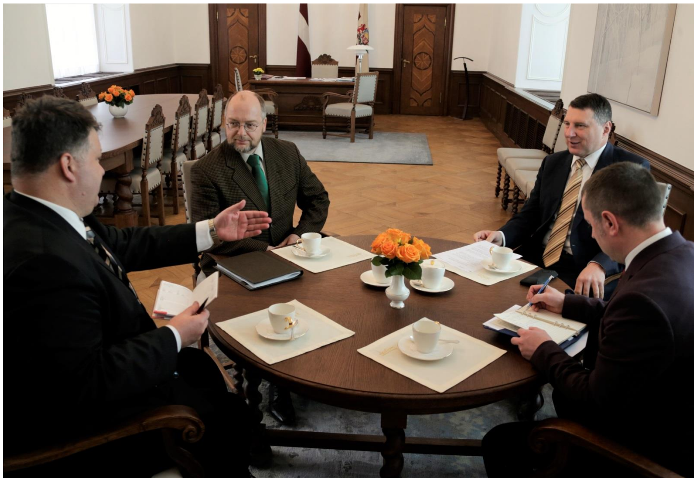
LBAS Leaders Visit the President of Latvia Raimonds Vējonis 25.04.2017.